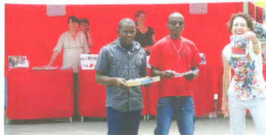
Am letztjährigen Flüchtlingstag im Juni nahmen wir zusammen mit Asylsuchenden aktiv teil.