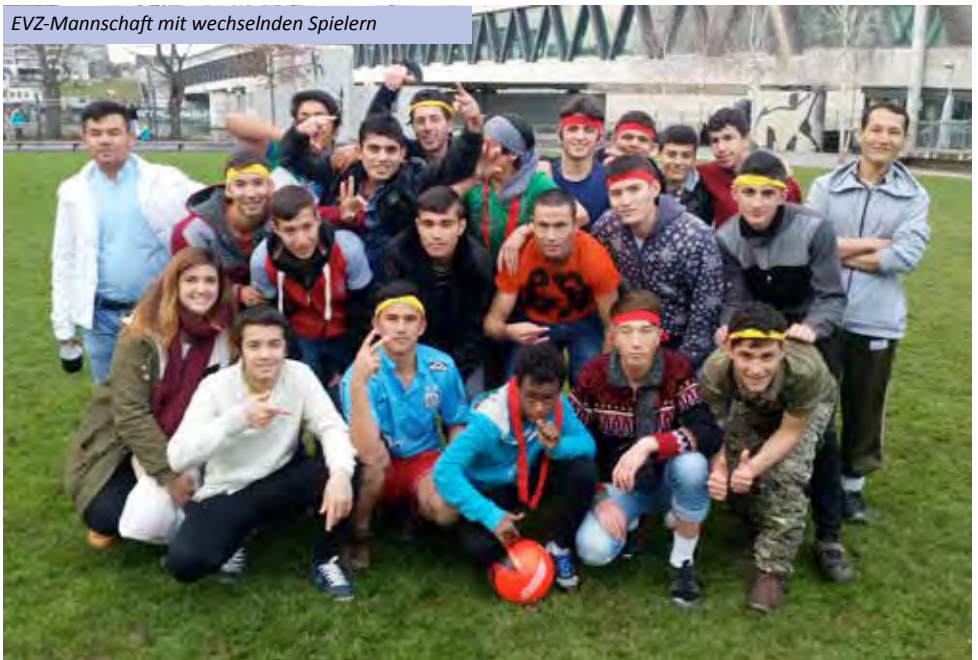
EVZ-Mannschaft mit wechselnden Spielern

Für uns alle war es ein Highlight, dass unser Team Ende November 2015 am jährlichen «Chlausencup» mitspielen durfte und Ben-